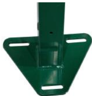
Столб с приваренным основанием треугольной формы для монтажа на винтовые опоры или прямоугольной формы для монтажа на фундамент