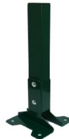
Основание для столба