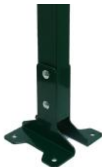
Основание для столба монтируется с помощью болтов М6*85, комплект из 2-х шт.