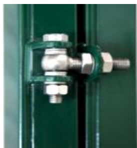
Петли регулируемые от 20 до 50 мм Угол открывания 180°