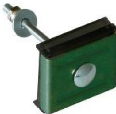
Крепление: скоба, болт М6, гайка антивандальная и шайба