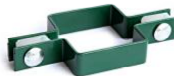
Крепление: позволяет исполнять углы поворота ограждений на любой градус без дополнительного столба.