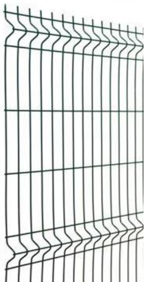
Панель сварная оцинкованная