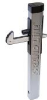
Фиксатор створки ворот: бетонируется на нужную высоту и удерживает створки ворот или калиток в открытом состоянии.