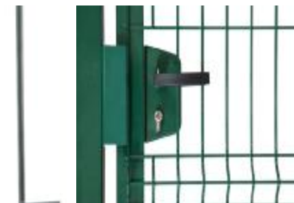
Замок с ручкой